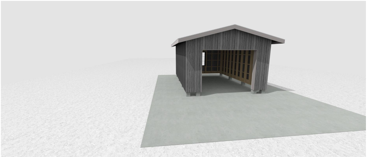
Tillval, Carport. Placering sker bakom stugan / i nordöstra hörnet av tomten.