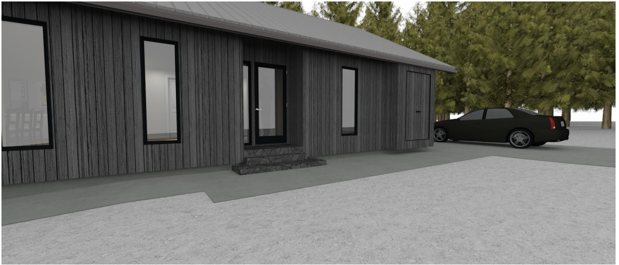
Skidförråd exempelvis vid hörnet.