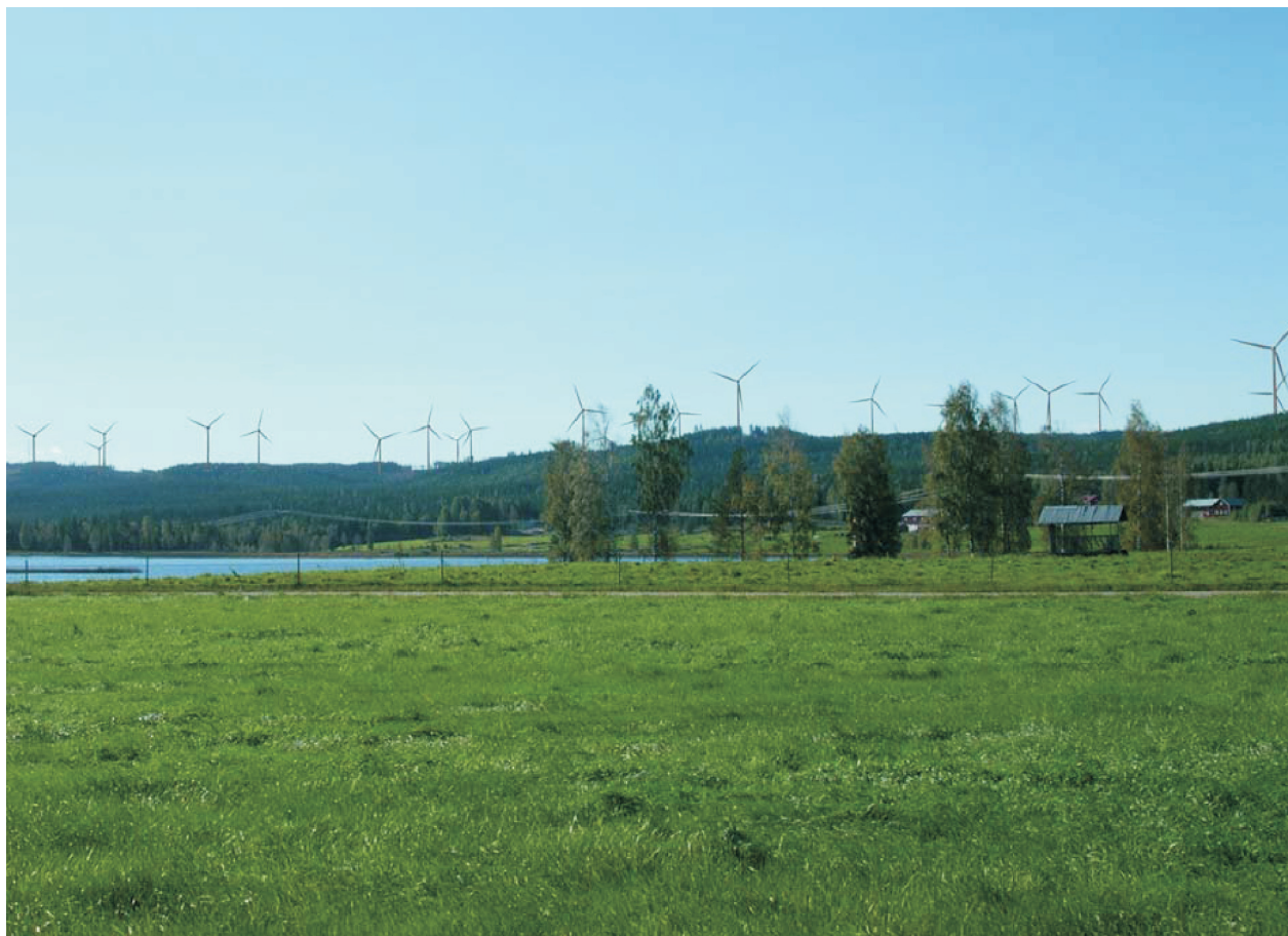
Fotomontage Tönsen/Storberget, Bollnäs. 24 av 34 vindkraftverk syns